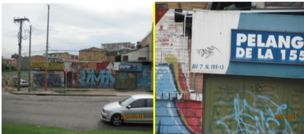
VISTA PANORÁMICA Y NOMENCLATURA DEL INMUEBLE - VALLA NO INSTALADA